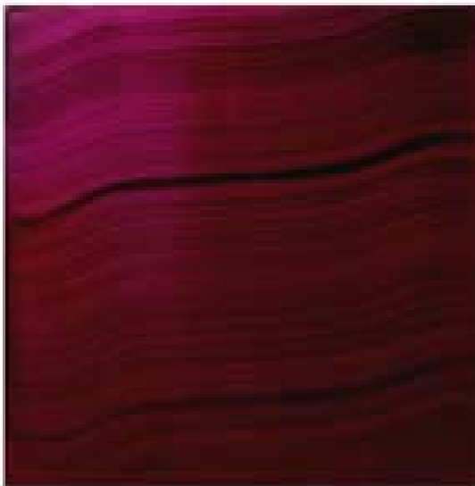
„Lothario“, 2003 Öl auf poliertem, rostfreien Stahl 200 x 200 cm

1915 malt Kasimir Malewitsch, der Vater der abstrakten russischen Kunst, ein rotes Quadrat und gibt seinem Bild den Titel „Bäuerin. Supernaturalismus“. Die Befreiung vom Bildgegenstand ist für ihn Voraussetzung für die absolute Herrschaft des künstlerischen Ausdrucks. Später haben Künstler ihre abstrakten Kompositionen nicht mehr betitelt und so jegliche naturalistische Interpretation negiert. Jason Martin versieht seine abstrakten Werke im Gegensatz zu vielen seiner zeitgenössischen Kollegen mit Titeln, die wie bei Malewitsch in keinem Zusammenhang mit dem Dargestellten stehen. Doch ist das bei Martin kein Ausdruck einer philosophischen Auseinandersetzung mit der Abstraktion, wie sie noch Malewitsch führte. Nichtgegenständliche Malerei hat sich seit langem etabliert und bedarf keiner Erklärung mehr. Martins Titel entstehen zufällig während des Werkprozesses, zum Beispiel aus der Musik, die nebenbei im Radio läuft, aus Tagträumen oder Überlegungen zu den Geschehnissen des Alltags. Diese zufälligen Titel sind unabhängig davon, ob die bildnerische Komposition wirklich Assoziationen zum Titel hervorruft. Der Betrachter ist verwirrt, gerät ins Grübeln. Warum gerade dieser Titel zu jenem Bild? Genau das will Martin erreichen, er will den Betrachter zum Denken anregen, damit er sich auf die Suche nach „passenderen“ Bildunterschriften machen soll, dabei sollen eigene Assoziationen geweckt werden.