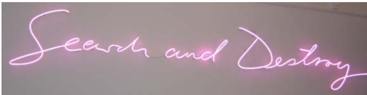
„Search and Destroy“, 2003 Neoninstallation Breite 350 cm

Der Künstler Lori Hersberger studiert unter anderem an der Schule für Gestaltung in Basel. Er gewinnt zahlreiche Preise und Stipendien – wie zum Beispiel den „Manor-Kunstpreis“, Basel und den „Cité Internationale des Arts-Preis“, Paris. Seit 1995 ist Hersberger mit seinen Werken auf Ausstellungen in Europa und Amerika vertreten. Im Jahr 1999 nimmt er mit einer Installation an der Biennale von Venedig teil.