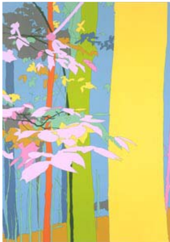
„Blind Corner“, 2003 Acryl auf Leinwand 213 x 152 cm

Farbe mit dem Pinsel auf der Leinwand um. Mit klar von einander getrennten Farbflächen in zumeist kontrastierenden dunklen und giftig grellen Tönen entsteht in ihren Bildern eine Ästhetik, die normalerweise für die plakative Photographie oder den Comic typisch ist. Bei der Wahl einer Farbe orientiert sich die Künstlerin nach formalen Kriterien, eine naturalistisch getreue Farbgebung ist nicht von Bedeutung. So können Baumstämme grün, blau oder gelb sein, die Blätter eines Strauches in den unterschiedlichsten Farben leuchten. Das Setzen der Farben erzeugt eine Atmosphäre, die den ganz subjektiven Eindrücken und Empfindungen der Künstlerin für ihr Bild entsprechen. Dieser Umgang mit Farbe lässt an Elemente der Fauves denken. Dazu gesellen sich nun Einflüsse der Pop Art und des subjektiven Expressionismus. Und am Ende verarbeitet Lisa Ruyter in einem innovativen Werkprozess traditionelle und postmoderne Stilelemente zu ganz eigenen Bildideen.