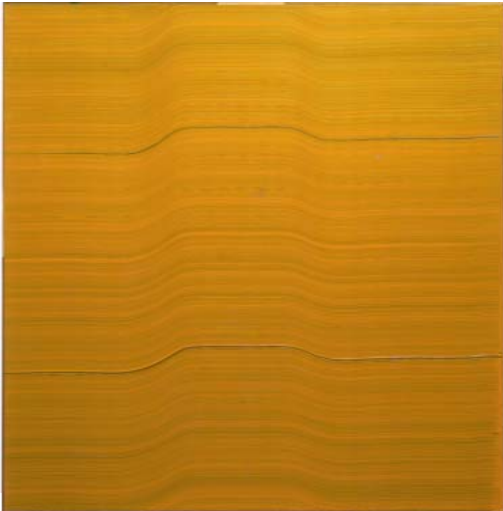
„Pharaoh“, 2000 Öl auf poliertem, rostfreien Stahl 150 x 150 cm

glänzende Malgrund durchschimmert. Mit dieser Konzentration auf den materialästhetischen Charakter eines Bildes ist Martin fest in der Tradition monochromer und gestischer Malerei verankert und liefert mit seinem jungen Werk einen neuen Beitrag zum breiten Feld der Erforschung der Farbe. Doch interessiert ihn dabei Farbe nicht nur in ihren koloristischen, sondern auch in ihren plastischen Eigenschaften „Mit Hilfe der Bildoberfläche einen Raum zu schaffen, ist für die Sensibilität eines Bildes von zentraler Bedeutung“, schreibt Martin selbst. Allein durch Rhythmus und Intervall der Kammführung kreiert der Künstler plastisch wirkende Bilder.