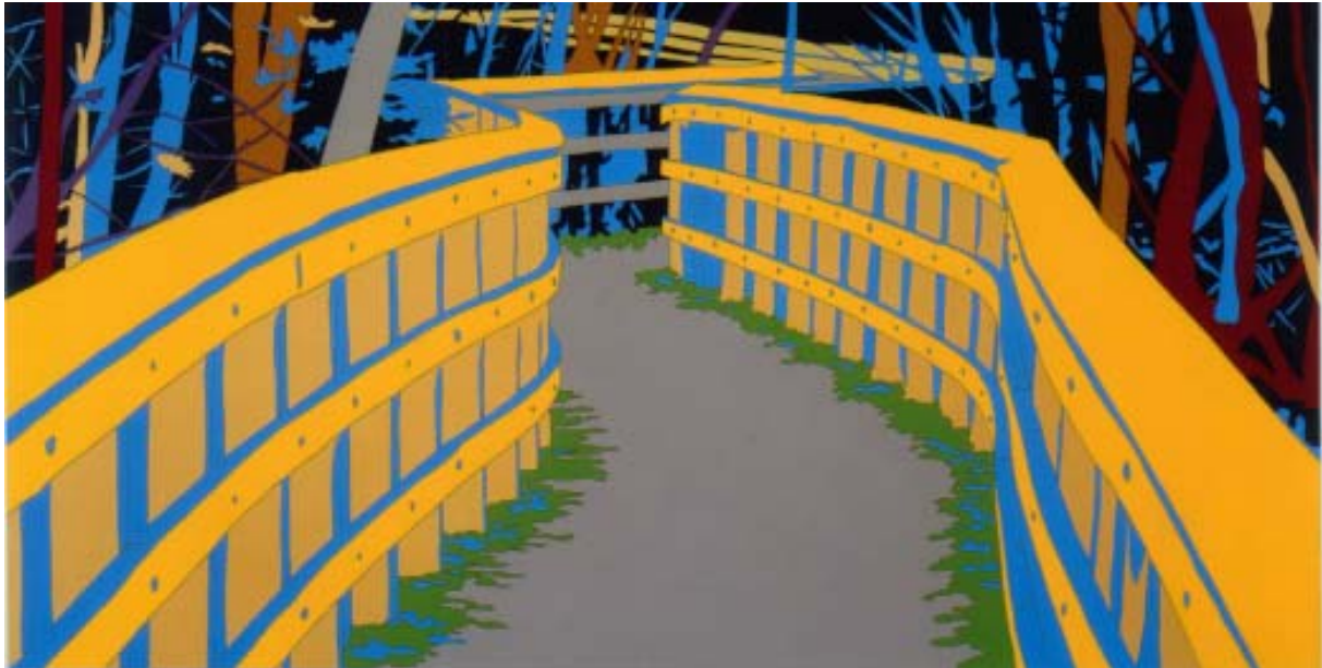
“The Sand Barrier”, 2003 Acryl auf Leinwand 91,4 x 182,9 cm