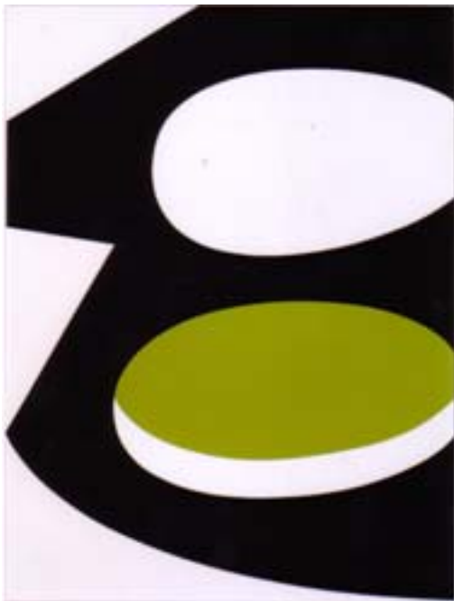
„o.T.“ (GR1075), 2003 Farbfolie auf Alucore, Aluminiumrahmen 130 x 100 cm

Wenn man heute Rockenschaubs formal sehr reduzierte Werke betrachtet, sind die Berührungspunkte seiner künstlerischen Arbeit mit seiner Tätigkeit als Techno-Produzent unübersehbar. Wie die Musik mit dem Synthesizer entsteht, entspringen auch Rockenschaubs Folienbilder dem Computer. Die abstrakt anmutenden Motive entstehen per Malprogramm, werden auf Farbfolie ausgedruckt und auf eine Aluminiumtafel kaschiert. Das Ergebnis ist ein industriell fabriziertes Bild, bei dem die Handarbeit des Künstlers auf ein Minimum reduziert wird. Diese Grundidee eines technischen Minimalismus ist auch der frühen Technomusik zu eigen. Was am Ende zählt ist das emotionale Erlebnis des Hörers oder des Betrachters.