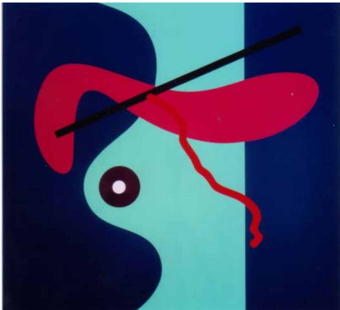
„o.T.“ (GR 1071), 2003 Farbfolie auf Alucore, Aluminiumrahmen 100 x 110 cm

ich täglich in einen Club gehe, habe ich ein anderes kulturelles Bewusstsein, als wenn ich täglich in die Oper gehe. Es ist einfach ein genereller Bewusstseinszustand, der alle weiteren Aktionen und künstlerischen Aussagen bedingt. Durch verschiedene Umstände hat es mich von der Musik ausgehend mehr auf die Seite der Kunst gezogen“, sagt er.