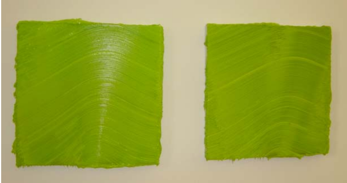
“Mercenary” (Dyptichon), 2003 Öl auf Aluminium Je 40 x 40 cm

Als 1999 das Brooklyn Museum of Art zum ersten Mal die provokanten Werke der so genannten Young British Artists unter dem Ausstellungstitel „Sensation. Junge britische Künstler aus der Sammlung Saatchi“ präsentiert, wird Jason Martin mit seinen Kollegen über Nacht berühmt. Im Gegensatz zu anderen Künstlern aus der Kollektion Saatchi erregt Jason Martin nicht durch blutige, animalische Kollagen und Skulpturen Aufsehen, sondern beeindruckt durch seine Fokussierung auf den reinen Charakter der Farbe. Der Künstler versieht Leinwand, Edelstahl, Aluminium oder Plexiglas mit einer monochromen Farbschicht. Mit speziell präparierten Kämmen und Bürsten erzeugt er dann fein strukturierte Oberflächen unterschiedlichen Charakters. So wird einmal die dicke Ölfarbe über die Kanten der Leinwand gezogen, ein anderes Mal die Farbe nur so dünn aufgetragen, dass durch die gestischen Kratzspuren der