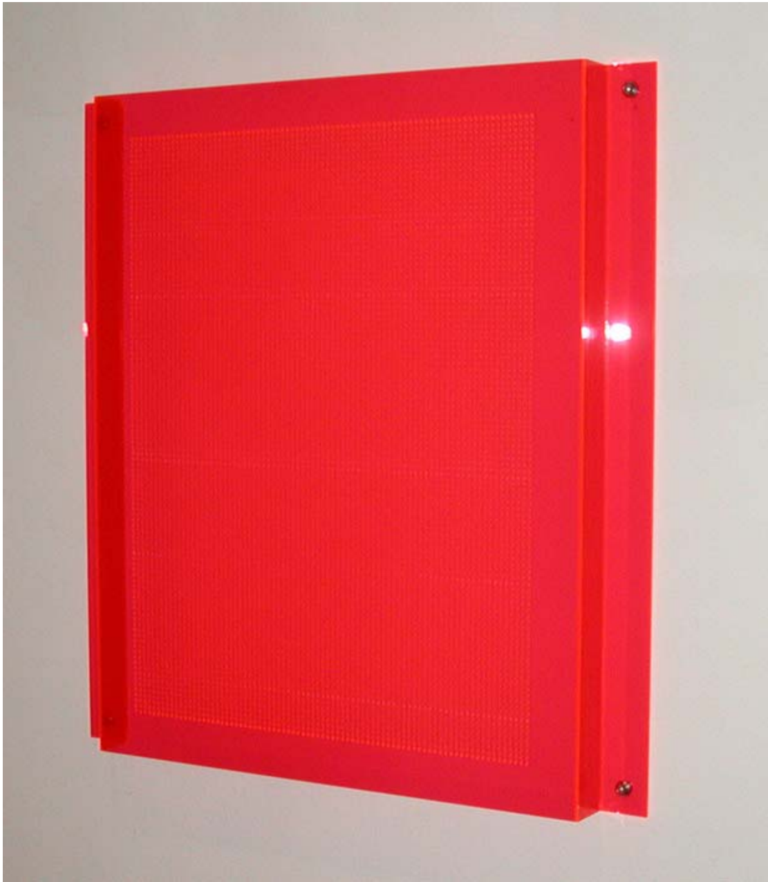
„o.T.“ (GR 1056), 2003 rotes Acrylglas, Kanten poliert 72 x 68 cm