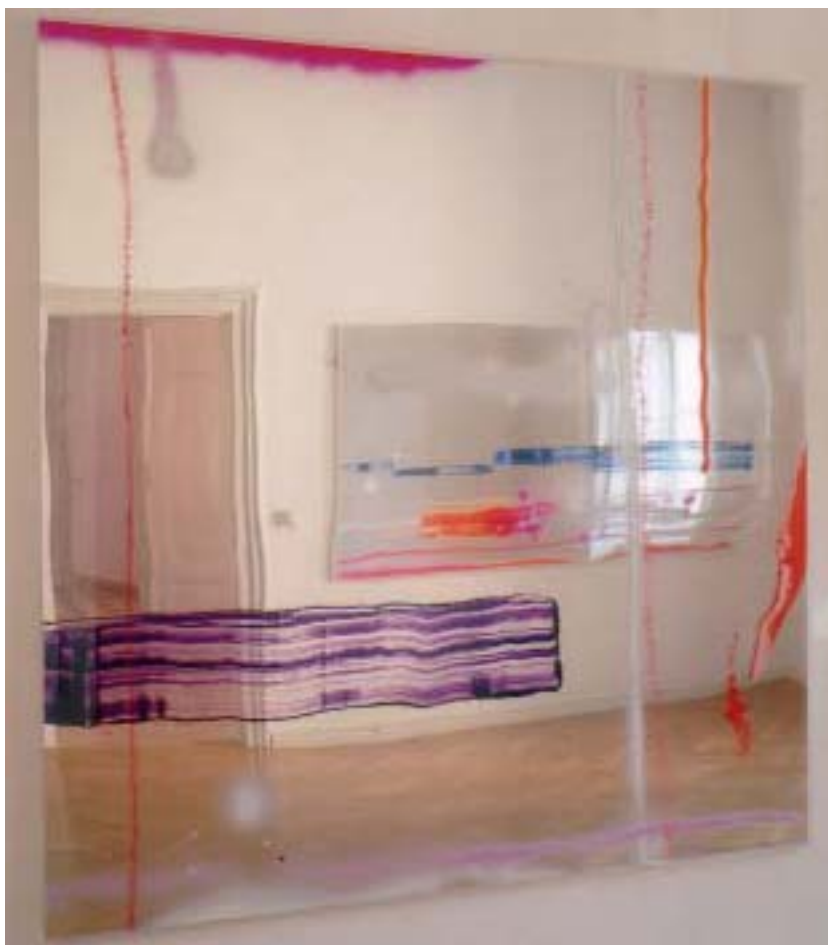
"Tomorrow", 2002 Acryl / Fluoreszenz, verspiegeltes Acrylglas 200 x 200 cm

mit den leer im Raum stehenden Worten. So wird dieser dazu angehalten ihnen eine eigene Bedeutung zuzuweisen. Das Suchen wird zur kreativen und produktiven Kraft, der Aufruf zur Zerstörung setzt sich über bestehende Verhältnisse hinweg. Der Betrachter soll sich kritisch auf die Suche machen, den Dingen auf den Grund gehen und somit einen neuen Raum für Evolution und Veränderung schaffen.