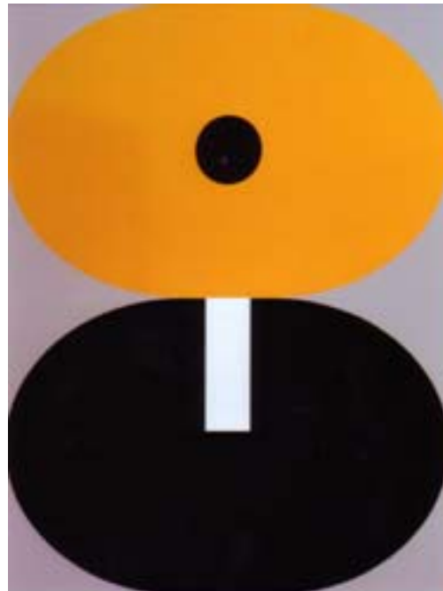
„o.T.“ (GR1076), 2003 Farbfolie auf Alucore, Aluminiumrahmen 130 x 100 cm

Rockenschaubs Computer generierte Wandbilder aus sparsam gesetzten Zeichen und Mustern tragen nie einen Titel, und trotzdem erscheint das