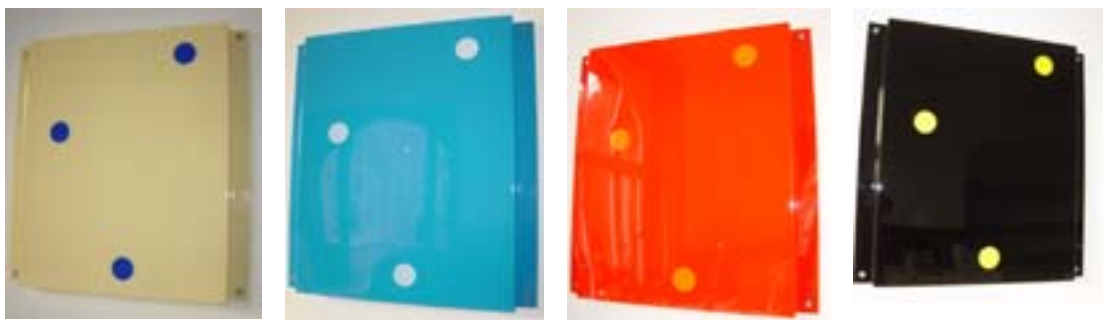
„o.T.“, 2003 rotes Acrylglas, gebogen und Kanten poliert je 72 x 68 cm

dargestellte Kontrastprogramm aus Form und Farbe nicht immer nur abstrakt, sondern beinhaltet durchaus auch figürliche Bezugspunkte. In „o.T.“ (GR 1074) formen sich die orangefarbenen, roten und schwarzen Fragmente - über eine rein visuell, dekorative Präsentation hinaus - zum Bild einer Gitarre. Formen und Farben lassen sich zu einem traditionellen Kulturzeichen zusammenfügen. Die Gitarre wird zum Ausdruck für eine Rückbesinnung auf die Grundwurzeln der Rockmusik.