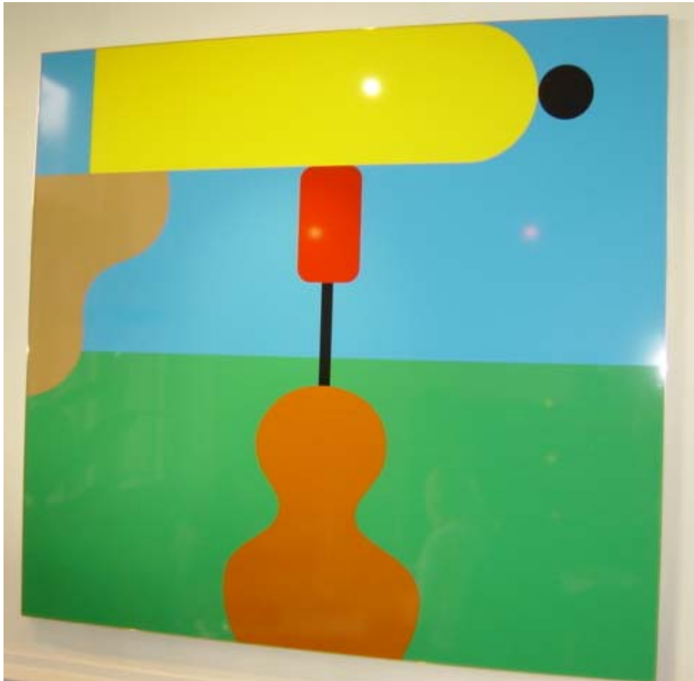
"o.T." (GR 1074), 2003 150 x 165 cm Farbfolie auf Alucore, Aluminiumrahmen